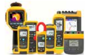
Térmico, eléctrico y mecánico