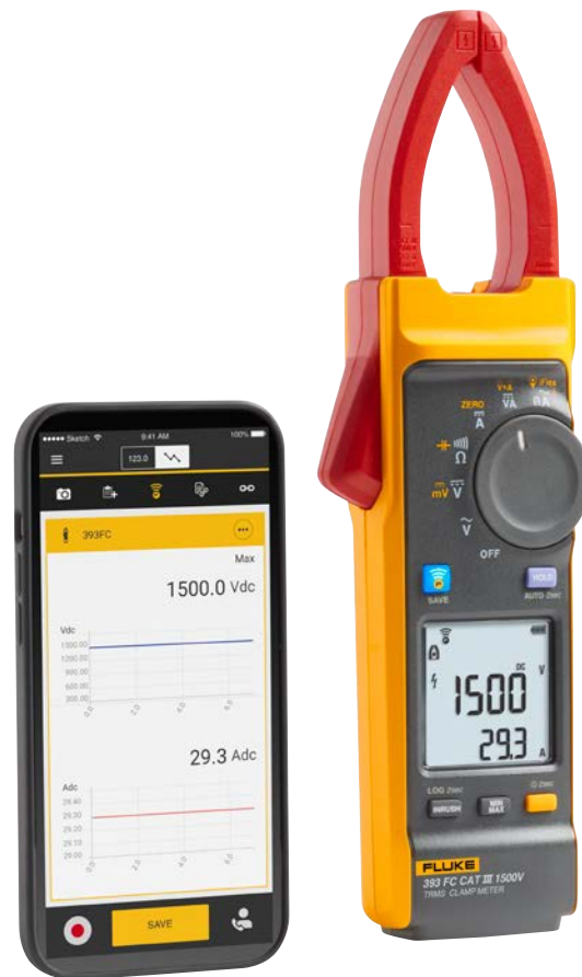
Figura 2 —La pinza amperimétrica de verdadero valor eficaz Fluke 393 FC CAT III 1500 V es la única pinza amperimétrica del mundo con la clasificación CAT III que cuenta con una clasificación adecuada para su uso en instalaciones fotovoltaicas de 1500 V.

¿Por qué utilizar una herramienta con la clasificación CAT III en instalaciones solares? Por una sencilla razón: su seguridad. No confíe su protección (o la de su equipo) a ninguna herramienta que no cuente con la clasificación adecuada para el trabajo.