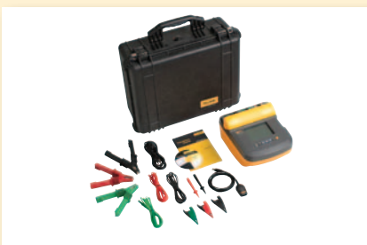
Juego medidor de aislamiento Fluke 1555